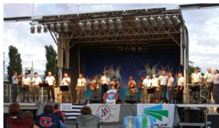
Le groupe « A Virer » dans le vieux port de Montréal (août 2006)